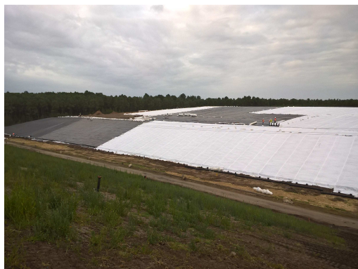
Pose du teradrain® sur la géomembrane en talus et sur dôme

Date du chantier : 2016 Nom de l'entreprise : Galopin Maître d'ouvrage : ADEME Maître d'œuvre : Safège Produits : teradrain® F16T1 (124000 m 2 ) / teradrain® F16T0,5 (82000 m 2 )