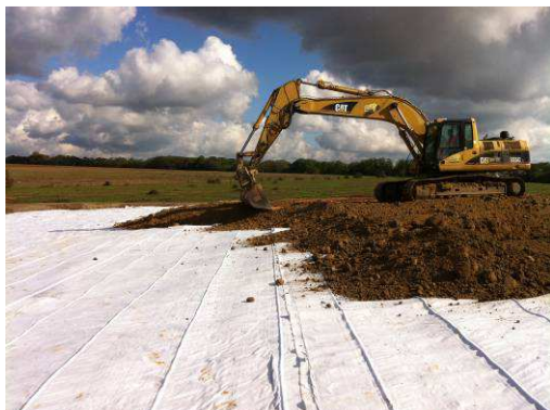
Mise en œuvre du teradrain®