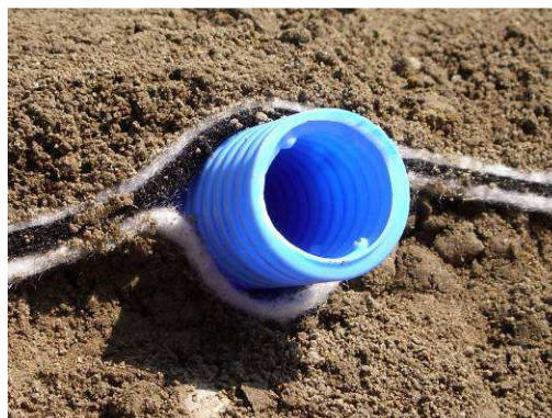
Géocomposite teradrain avec mini-drain collecteur®