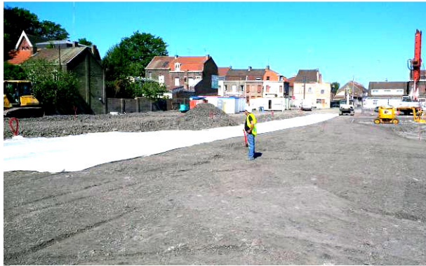
Mise en place des nappes de renfort HS800/50

Produits : BONTEC FORCE HS800/50 (3500 m 2 )