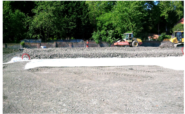
Remblaiement et compactage au dessus des nappes de renfort